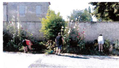
Avec le printemps, retour de l'entretien des massifs dans le bourg par les bénévoles