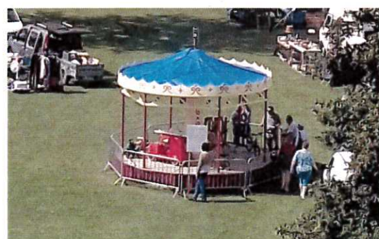
le fameux manège exposé le jour de la fête

Depuis plusieurs semaines, les allemansois ont pu voir des caméras à l'école, à l'église et dans le parc du manoir. En fait, rien de plus normal puisqu'un manège construit par des habitants de la commune dans les années 60 (en 1967 pour être précis) est au coeur du sujet. Le fameux manège était exposé le 24 juin . Le tournage s'est terminé dimanche 1 juillet dans le parc.