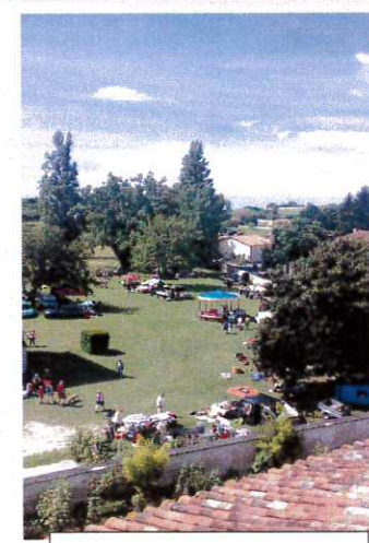
Vue du clocher très visité ce 24 juin

85 casse-croûtes le matin, 214 repas servis à midi (il a fallu s'arrêter là malgré la demande !)