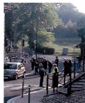
tournages à l'école et à l'église