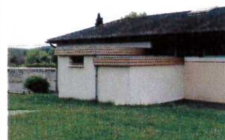
L'extension de la salle des fêtes est terminée