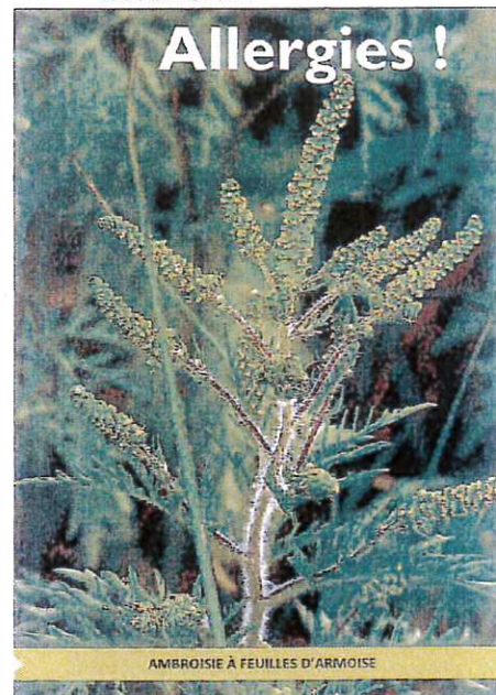
AMBROISIE À FEUILLES D'ARMOISE