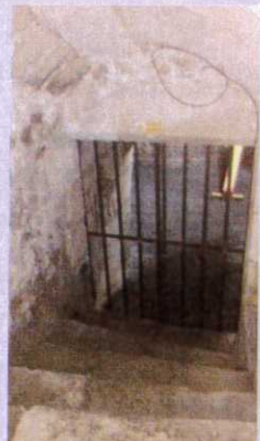
L'entrée de la cave et la cave Nous cherchons des barriques !