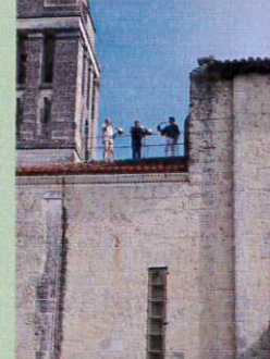
Sonneurs de cors au clocher de l'église

Comme l'an passé, plus de 200 repas servis à midi.