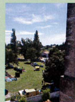
Vue du clocher (ouvert au public ce jour-là)