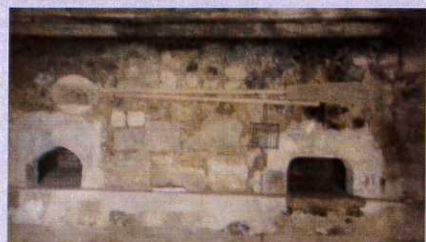
Les travaux dans le four à pain avancent. L'ouverture des cheminées reste à faire.