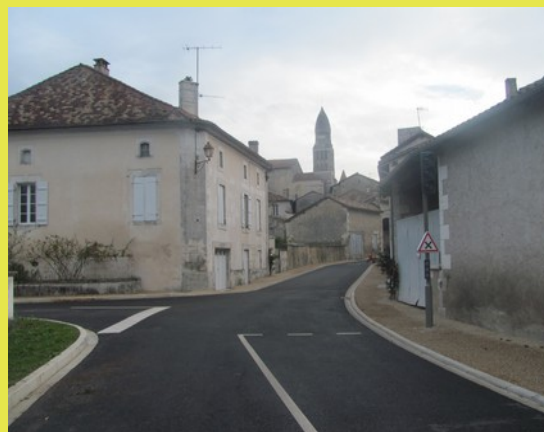
La même photo au début du 20ème siècle, en 2011 et fin 2015

D'autres aménagements du bourg sont en projets (carrefours en direction du Puy de Beaumont et du Prieur). Et pour éviter des imprécisions quotidiennes (pour le courrier comme pour les services d'urgence), des noms de rues seront également donnés