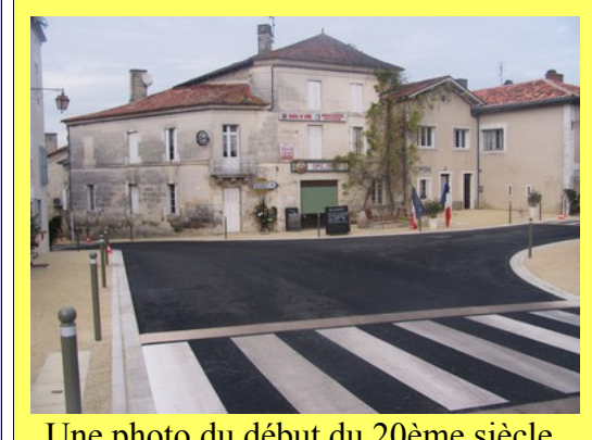
Une photo du début du 20ème siècle. La même vue fin 2015