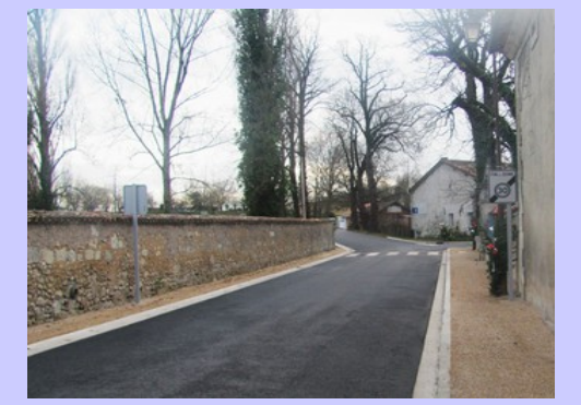
Les photos situées sur la rangée haute sont de 2011 après la rénovation de la chaussée. Celles du bas sont de fin 2015