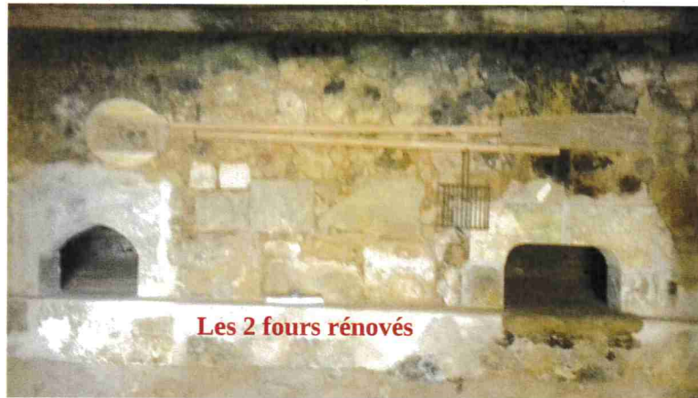
Les 2 fours rénovés