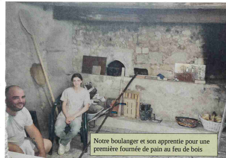
Notre boulanger et son apprenti pour une première fournée de pain au feu de bois