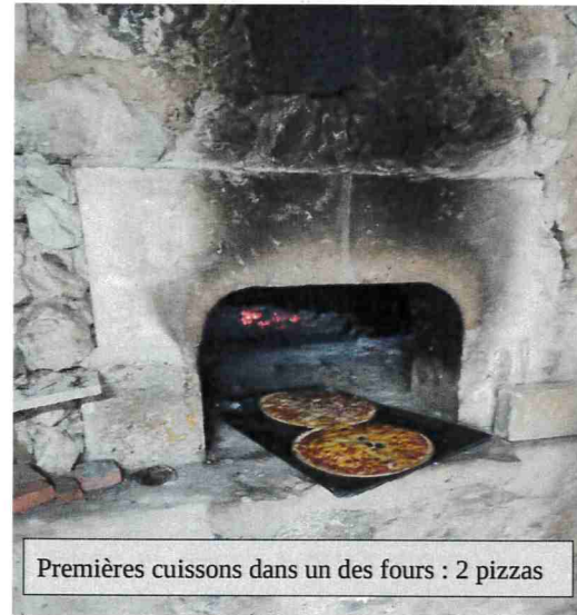
Premières cuissons dans un des fours : 2 pizzas