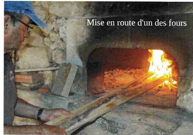
Mise en route d'un des fours