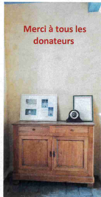
Merci à tous les donateurs