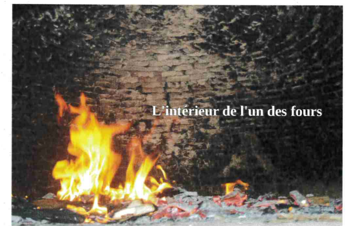
L'intérieur de l'un des fours