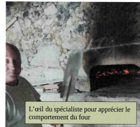
L'œil du spécialiste pour apprécier le comportement du four