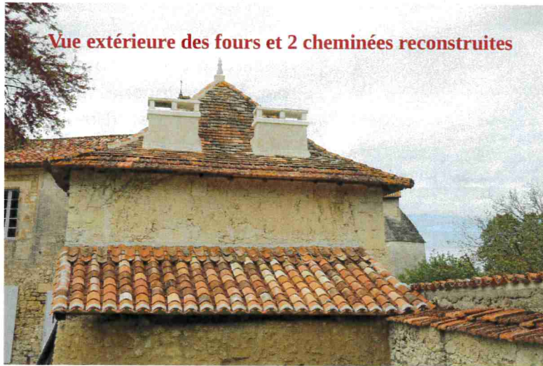
Vue extérieure des fours et 2 cheminées reconstruites

Les fours à pain : la rénovation de ce beau bâtiment s'est en partie achevée avec la mise en route des fours. Premières chauffes, premières cuissons modestes avant la première fournée de pain réalisé par notre boulanger : un vrai succès. C'est une belle récompense pour tous les bénévoles qui ont participé aux travaux de remise en état. Ces derniers ont été financés par la commune.